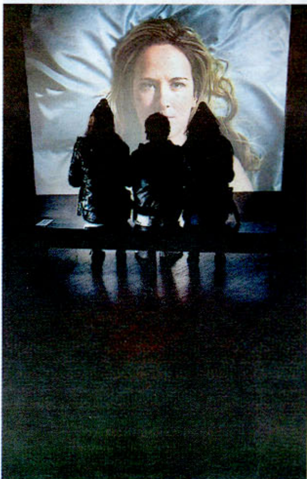
I verket "Evil Eye" möter publiken konstnären själv. Ljudbandet och ögonen är centrala.